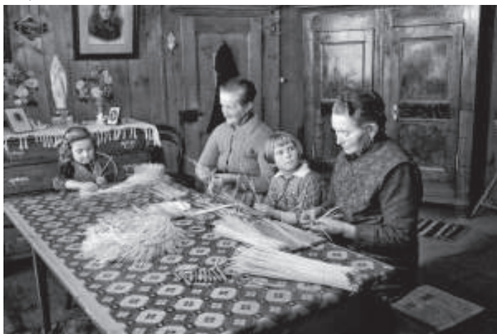
Reconstitution du tressage de la paille, reportage dans le dernier village où il se pratiquait, à Sorens. le 2 janvier 1942.

Le tressage de la paille occupe de nombreuses mains dans la région, de 1830 aux années 1910. Femmes et enfants s'affairent, à domicile, à cette tâche fastidieuse. Des entrepreneurs et des intermédiaires locaux organisent le travail, fournissent les modèles, contrôlent la qualité du produit et assurent le transport. Les tresses sont livrées à des fabricants de chapeaux en Argovie. L'évolution de la mode et la concurrence asiatique provoquent la chute des prix, puis la disparition de cette activité au début du XX e siècle.