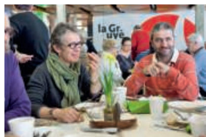
Inauguration et brunch des AMG.