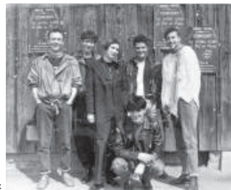
Gruppe de fondateurs d'Ebullition, Bulle, 1991