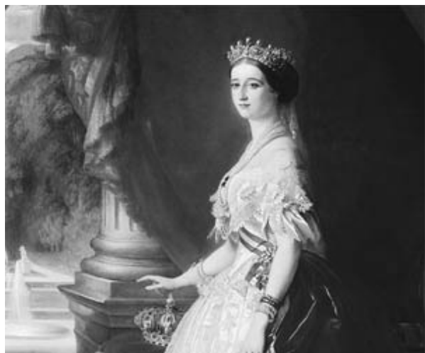
Les AMG hôtes de la reine Hortense au château d'Arenenberg

Repas du soir et divertissement musical au centre de Constance. Nuit dans le même hôtel.