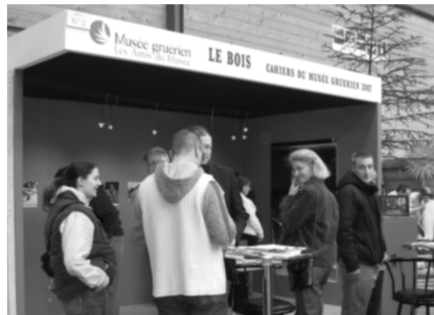
L'un des forums du Salon Bois 2007 : le stand des AMG