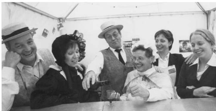
Musalire, juin 1998