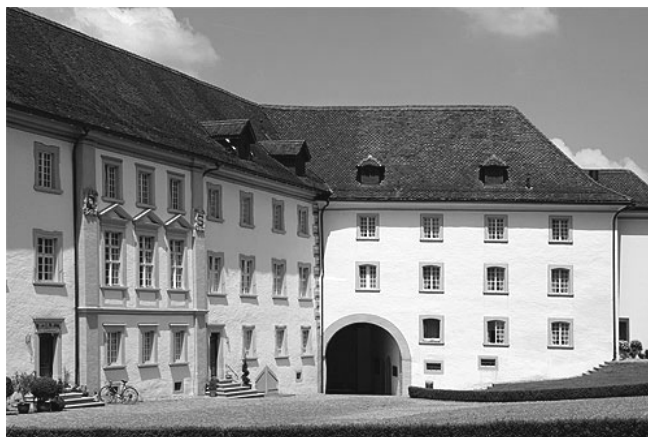
L'abbaye lucernoise de Sankt Urban, splendeur baroque cistercienne

Visite guidée (1h 1/2) de Constance (cathédrale, centre historique, ruelles piétonnes). Temps libre pour le shopping ou la visite individuelle de musées et le repas de midi. Au retour, nous ferons halte à l'abbaye de Sankt Urban /LU, impressionnant témoignage de l'architecture baroque cistercienne. Derrière une façade sévère nous découvrirons (visite guidée) une église à l'ambiance noble et solennelle. Chœur orné de magnifiques stalles sculptées du 18 e siècle. Goûter sur place. Retour à Bulle vers 20 heures. (m.-a. c.)