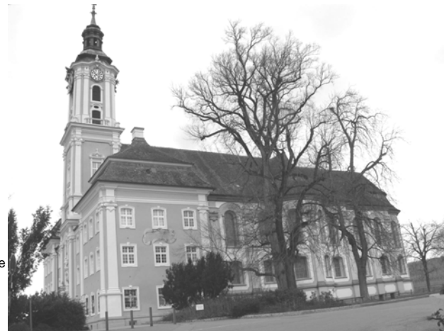
L'église de Birnau