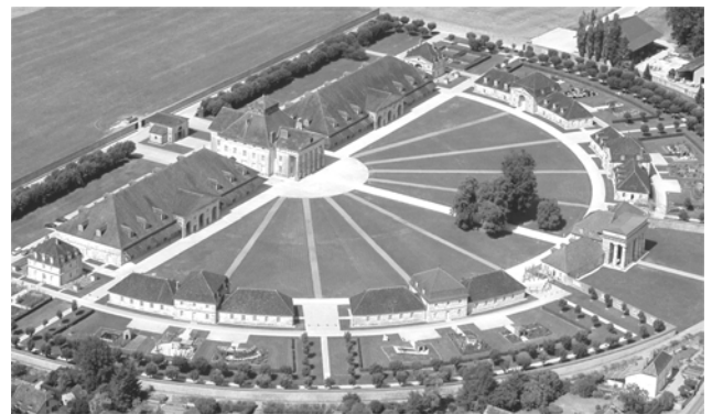
La Saline Royale d'Arc et Senans

Dimanche 9 décembre Café littéraire au Musée.