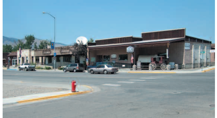
Le Lemhi Historical Museum et la bibliothèque municipale à Salmon (Idaho)