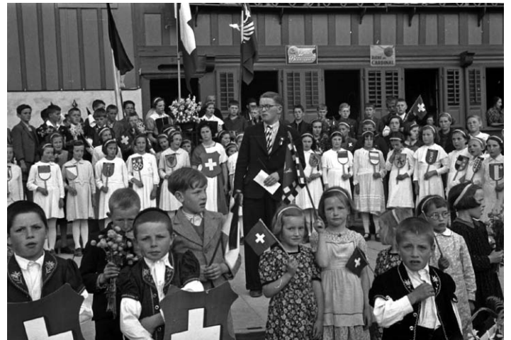
Fête des 650 ans de la Confédération en 1941.