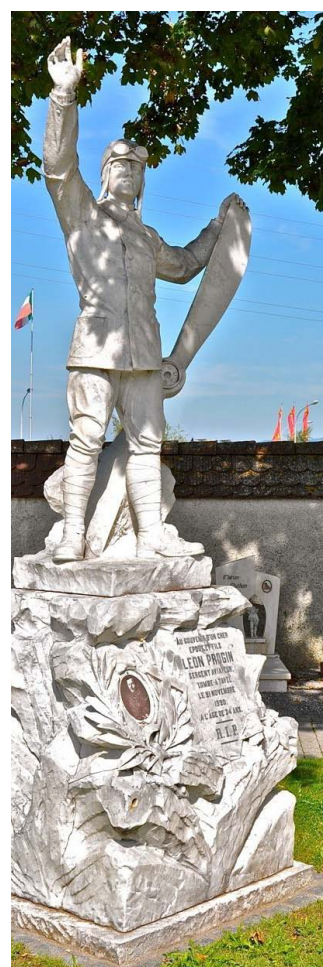
Tombe de l'aviateur Léon Progin.

Une participation de Fr. 5.– sera perçue sur place.