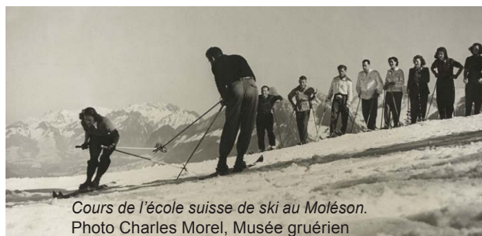
Cours de l'école suisse de ski au Moléson.