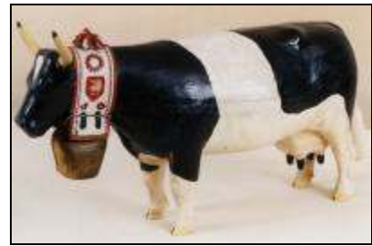
Vache fribourgeoise bois peint, vers 1950 Musée gruérien IG 7462