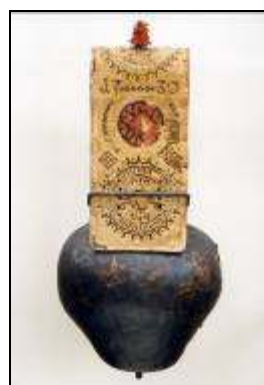
Sonnaille avec collier brodé 1730 Musée gruérien, MG 20120

Les expositions semi-permanentes bénéficieront d'une infrastructure simple et modulaire. En alternance on y découvrira des ensembles d'œuvres d'art, des séries d'objets sortis des dépôts et des images tirées des fonds photographiques.