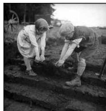
Le Crêt, dans les tourbières, 1936