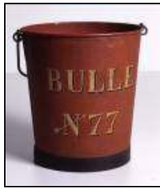
Seau à incendie, Bulle XIX e siècle Musée gruérien IG 3290