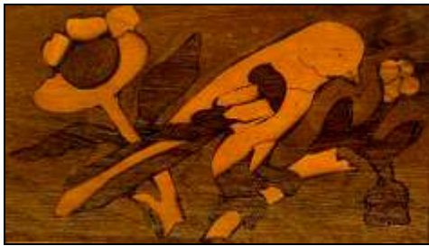
Coffret fin XVIIe siècle, Bois de noyer, incrusté. Détail Musée gruérien IG 3801