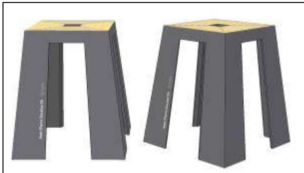
Le tabouret de l'exposition permanente. christophemoinatdesign

Vous avez la possibilité de marquer votre soutien au projet en utilisant les deux formulaires annexés.