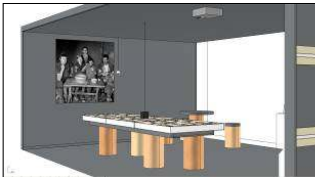
Stand AMG au Comptoir gruérien 2009 christophemoinatdesign