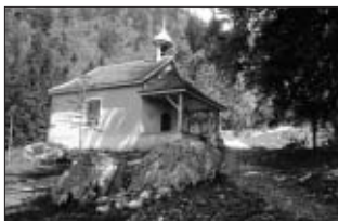
Estavannens, la chapelle du Dah. © Charles Morel – Musée gruérien]