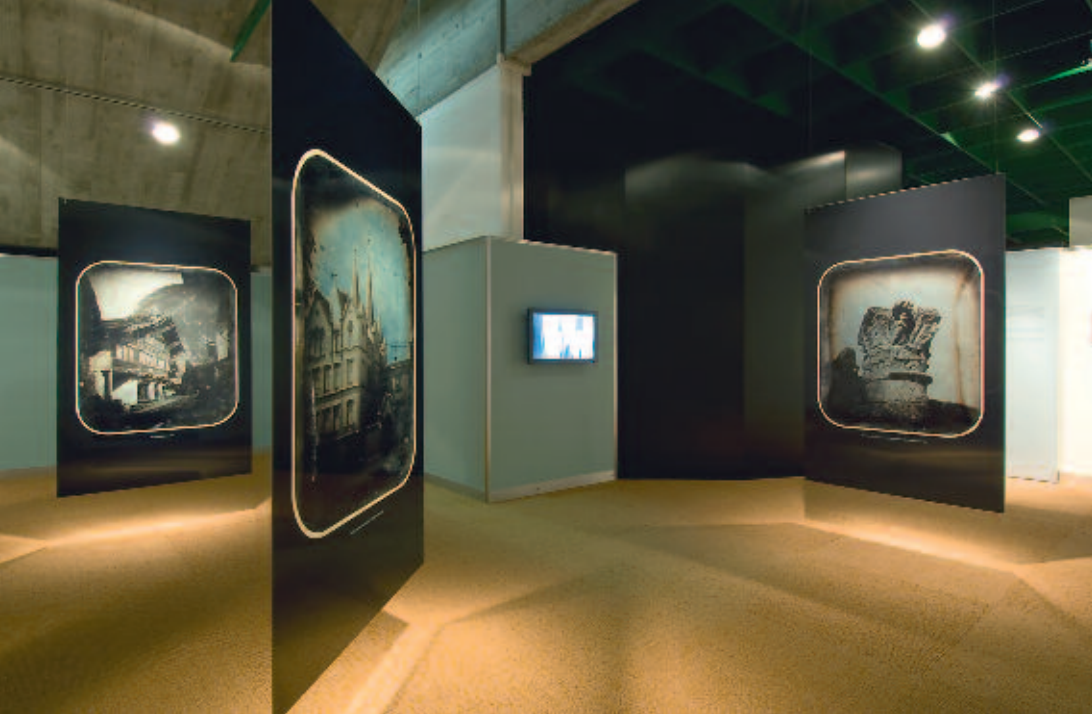
L'exposition Miroirs d'argent. Daguerrotypes de Girault de Prangey (2008-2009).

Fernsehen, la revue Géo , l'Alpe, Connaissance des Arts , Images , et de nombreux quotidiens romands et allemands. Le site internet www.musee-gruerien.ch a reçu 64 380 visiteurs en 2008, soit 176 par jour. Le musée contribue activement au nouveau site www.musees-en-gruyere.ch inauguré en juillet et entretient sa visibilité sur de nombreuses bases de données touristiques et culturelles.