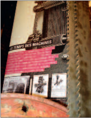
L'exposition Précieux Bois (2008)

Précieux Bois. L'exposition rassemble des outils, des meubles, des photographies et des témoignages pour évoquer l'industrialisation, les propriétés des bois et l'histoire de ce matériau. Des installations interactives permettent une approche sensorielle. L'École professionnelle et artisanale de Bulle a collaboré à la réalisation soutenue par les partenaires des AMG. Les expériences sensorielles Touche du bois ont bénéficié du soutien du Kiwanis-Club la Gruyère. Le public et les Amis ont apporté en prêt et en don des objets et documents qui enrichissent les connaissances et les collections du Musée sur un pan important de l'économie et de la culture régionales.