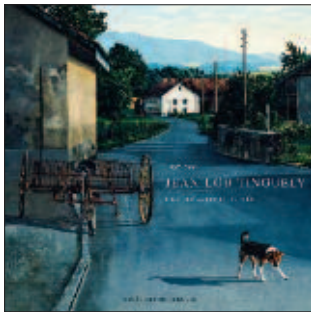
Couverture du catalogue de l'exposition Jean-Lou Tinguely, La célébration du réel (2007).

Jean-Lou Tinguely, la célébration du réel. Une rétrospective de l'artiste né à Bulle présente une centaine d'œuvres provenant de nombreuses collections privées. Sous la direction de Denis Buchs, Béatrice Lovis a fait l'inventaire des œuvres. Un catalogue de 132 pages et 75 illustrations a été édité par le Musée. Des visites ont été commentées par des artistes et des ateliers créatifs ont accueilli les enfants.