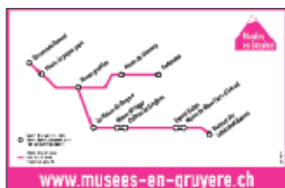
Afin de mettre en évidence la richesse et la densité de l'offre muséale régionale, le visuel de l'association Musées en Gruyère s'est inspiré d'un plan de métro. © Musées en Gruyère. Epure

Des mesures ont été prises avec les entreprises concernées pour pallier les défauts de climatisation subsistant depuis 2002. L'éclairage de secours a été partiellement remplacé, les dispositifs de sécurité réactualisés et le personnel formé. Un dépôt extérieur est à trouver.