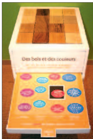
Un module de l'exposition Précieux Bois (2008)

Les recherches effectuées pour le numéro 6 des Cahiers du Musée gruérien ont posé les bases pour toute une série d'événements qui contribuent au rayonnement du Musée gruérien: stand au Salon bois en février 2007, journées du patrimoine sur le bois en septembre 2007, stand au Salon bois 2008 (hôte d'honneur), conférences publiques en relation avec l'exposition Précieux Bois organisée en 2008.